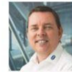
Andre Fritsch Senior Product Manager Remote... R. STAHL